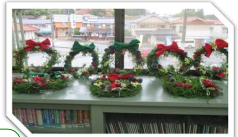
かずらリースに飾りつけ!

昨年、児童たちが当教室で作った作品の一例です。このほか、シャボン玉、ホタルかご、ハロウィン、おやつ作り(チョコレートパフェ)など、教室は興味深く楽しく過ごせる場所となっています。