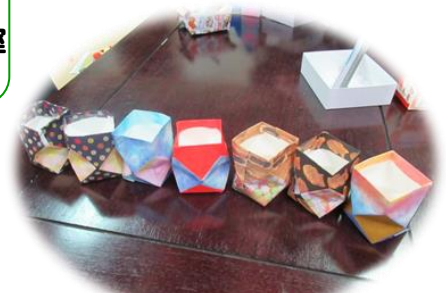
牛乳パックでペン立て!!

テレビ11チャンネル初期画面 ↓ お知らせ ↓ 決定を押す 豊松協働支援センター ↓ 選択・決定 項目