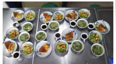
12月の料理:ケーキ・サレなど

10回目 1月21日(月)9:30～ 白菜特集：白菜の重ね煮、白菜のきのこお浸し、白菜のミルクスープなど 11回目 2月20日(水) 9:30～ 大根特集：炊飯器でふるふき大根、ジャーマン大根など