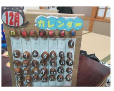
どんぐりカレンダーでき上がり!

昨年、児童たちが当教室で作った作品の一例です。このほか、シャボン玉、ホタルかご、ハロウィン、おやつ作り(チョコレートパフェ)など、教室は興味深く楽しく過ごせる場所となっています。