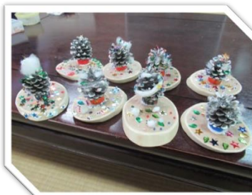
松ぼっくりでツリーが完成!!